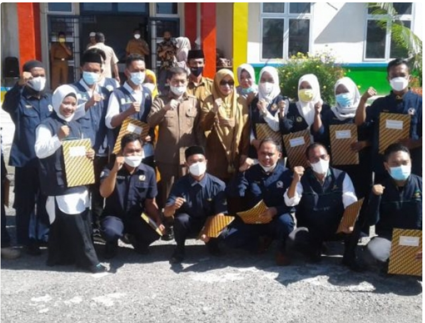
Gambar : Sekda Aceh Tenggara Poto Bersama 16 Anggota TKSK

Aceh Tenggara - Sekretariat Daerah (Sekda) Kabupaten Aceh Tenggara mengukuhkan dan sekaligus membagikan Surat Keputusan (SK) kepada 16 orang Tenaga Kesejahteraan Sosial Kecamatan (TKSK) se-Kabupaten Aceh